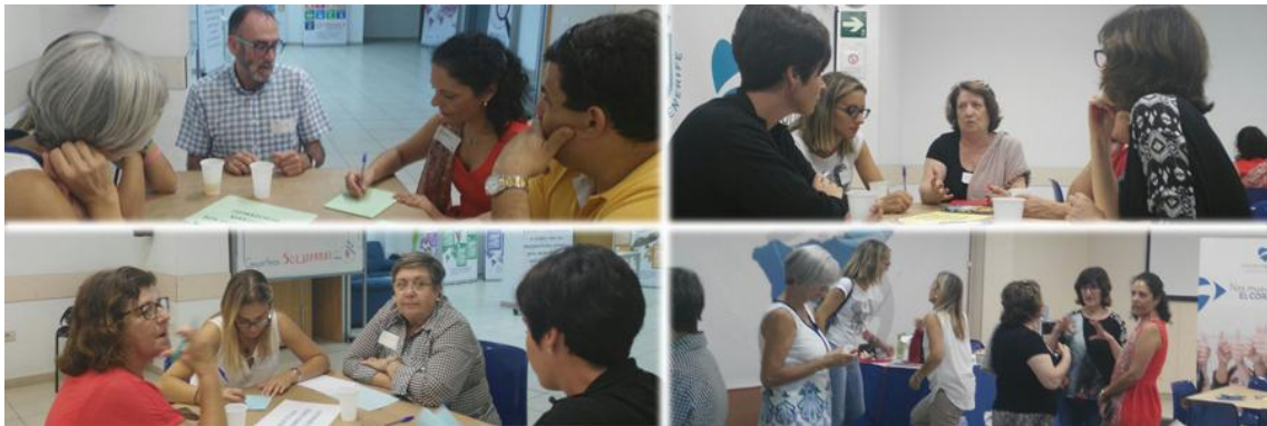
Distintas mesas de trabajo

Durante el ejercicio 2017 hemos tenido una gran colaboración con Tenerife Solidario con reuniones y actos conmemorativos, con diversas mesas de trabajo sobre temas de voluntariado.