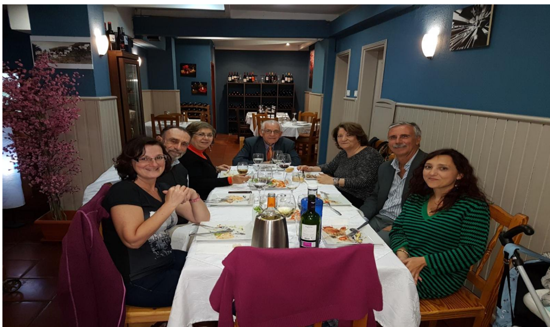
Junta Directiva en la comida de amistad finalizando el año 2017

La Junta directiva con motivo de las Fiestas Navideñas y finalización del Ejercicio 2017, celebramos un almuerzo compartido.