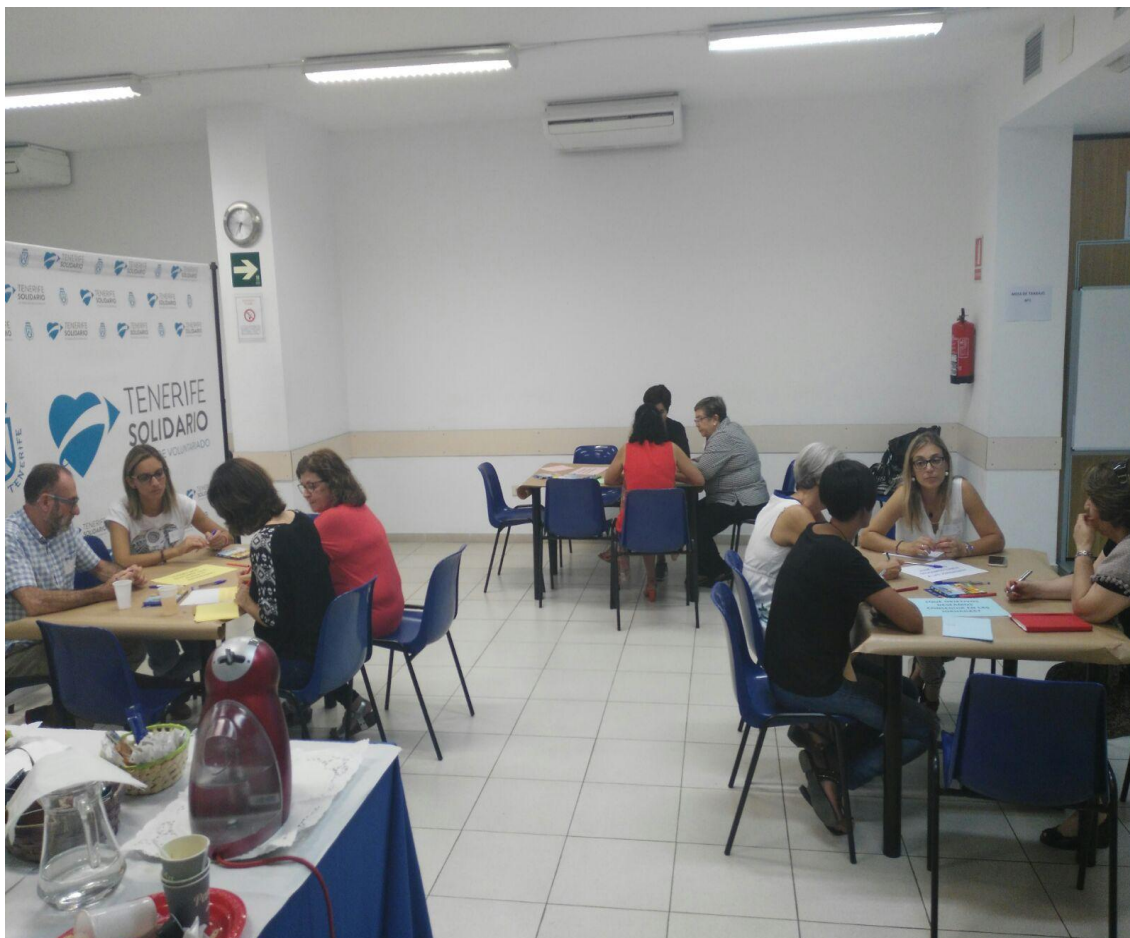
Diversas mesas de trabajo