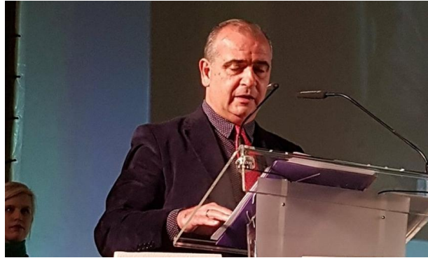
Don Luciano Poyato en la inauguración

El Congreso Estatal de Voluntariado que se ha celebrado en Sevilla los días 22 y 23 de noviembre de 2017 y en el que participaron más de un millar de personas, supone el pistoletazo de salida a unas semanas de reconocimiento a la tarea solidaria. El Congreso se realizó con el objetivo de abrir un espacio de reflexión, intercambio de experiencias y debate para que las personas participantes se comprometan con la acción solidaria, en pro de la transformación social. Luciano Poyato, Presidente de la Plataforma del Voluntariado de España (PVE) y de la Plataforma del Tercer Sector (PTS), ha manifestado durante la inauguración que “en este país hacen falta más personas voluntarias” y ha asegurado que «ellas son el corazón del Tercer