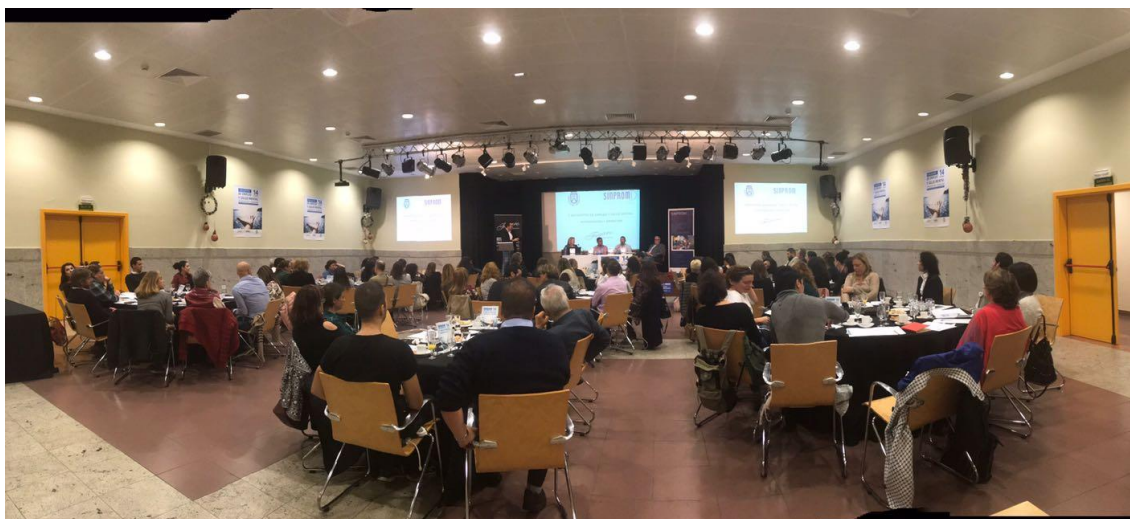
Desayuno de trabajo

cuentan con alguna discapacidad relacionada con la salud mental, se siguen dando pasos. En este sentido, el Presidente quiso resaltar el trabajo y la dedicación de los Equipos de Apoyo Individualizado al Empleo (EAIE) de Sinpromi, unidad especializada en el trabajo con la salud mental que, hasta este mes de diciembre, han realizado un total de 200 contratos laborales de personas de difícil inserción. El encuentro pretendió aportar a todos los presentes una visión clara de las estrategias y acciones de intervención que se están llevando a cabo en la actualidad.